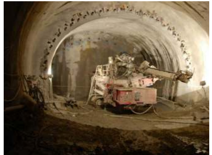
Equipement RODIO SR510 dans le tunnel du Los 1300